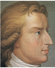
FRIEDRICH SCHILLER 1759–1805