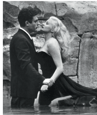
Anita Ekberg in La dolce vita (1960) indossa un abito delle Sorelle Fontana.

1 Zoe Fontana (1911–1979), Micol Fontana (1913–2015) e Giovanna Fontana (1915–2004)