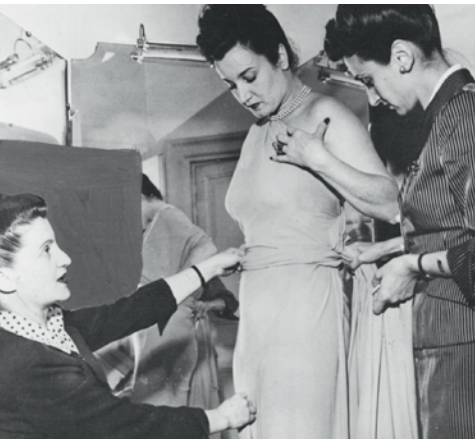
Le Sorelle Fontana nel loro atelier romano