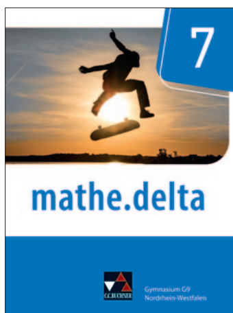
mathe.delta 7 ISBN: 978-3-661-61167-9