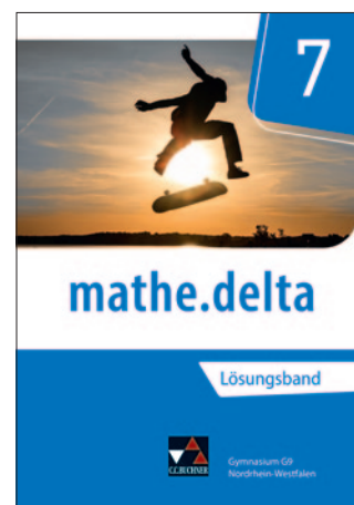
Lösungsband 7 ISBN: 978-3-661-61187-7