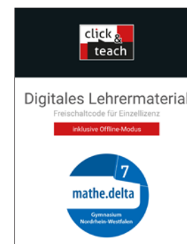
click & teach 7 Box Digitales Lehrmaterial (Karte mit Freischaltcode) ISBN: 978-3-661-61197-6