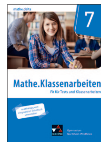
Mathe.Klassenarbeiten 7 ISBN: 978-3-661-61193-8