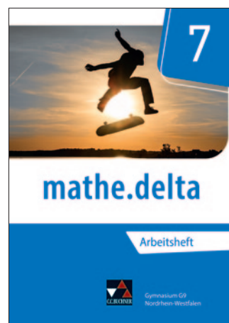
Arbeitsheft 7 ISBN 978-3-661-61177-8